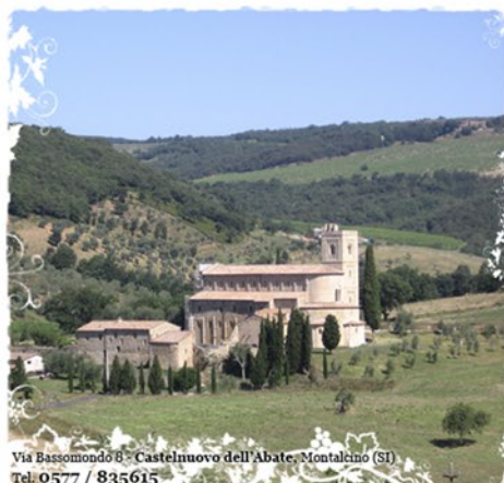
Via Bassomondo 8 - Castelnuovo dell'Abate, Montalcino (SI) Tel. 0577 / 835615